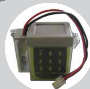
Batterie de secours (pour le 24V)

• Options : système GATECODER de détection d'obstacles et fins de course