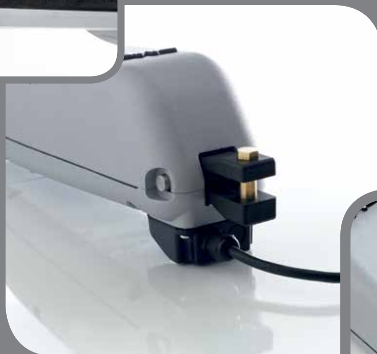
Branchement du câble d'alimentation par boîtier étanche