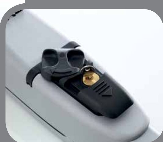
Déverrouillage par clé facile d'utilisation

• Le 413 existe en ensemble complet TRENDY Kit